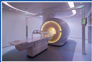
بخش MRI بیمارستان پیامبر اعظم (ص) قشم

افتتاح ۲۵ پروژه بهداشت و درمان استان هرمزگان با اعتباری بالغ بر ۵۲۷۳ میلیارد ریال