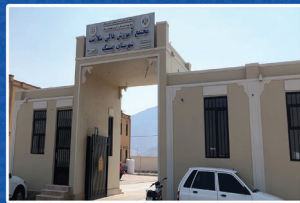
مجتمع آموزش عالی سلامت بستک