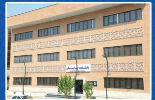
دانشکده پیراپزشکی شهرستان بندرعباس