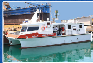
آمبولانس دریایی جزیره ابوموسی