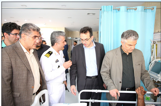
مهر تآ مهر دستآورد دولت چهاردهم در حوزه بهداشت و درمان آستان هراگان