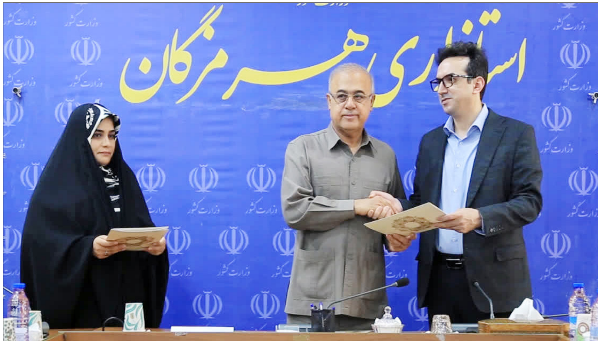
مهر تا مهر دستاورد دولت چهاردهم در حوزه بهداشت و درمان استان هرمزگان