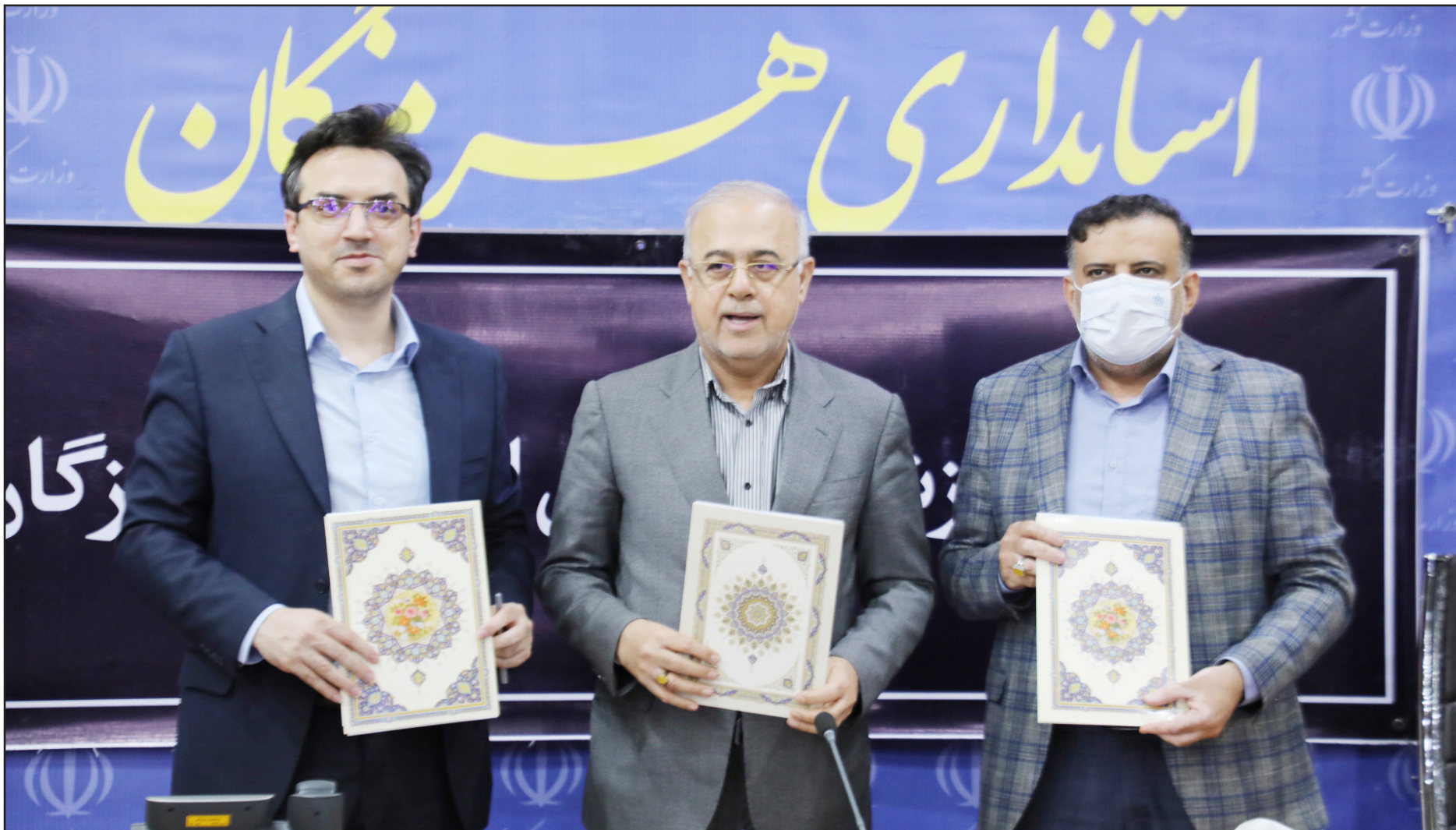
مهر تا مهر دستآورد دولت چهاردهم در حوزه بهداشت و درمان استان هرمزگان

بنا بر مفاد این تفاهنامه، آموزش و تربیت نیروهای بهیاری با همکاری مشترک سه دستگاه انجام می‌شود تا بخشی از کمبود نیروی پرستاری و کادر درمان در بیمارستان‌ها و مراکز جامع سلامت استان جبران گردد. بهیاران به‌عنوان نیرویی ارزشمند می‌توانند نقش مؤثری در بهبود فرآیندهای درمانی و ارائه خدمات سلامت ایفا کنند