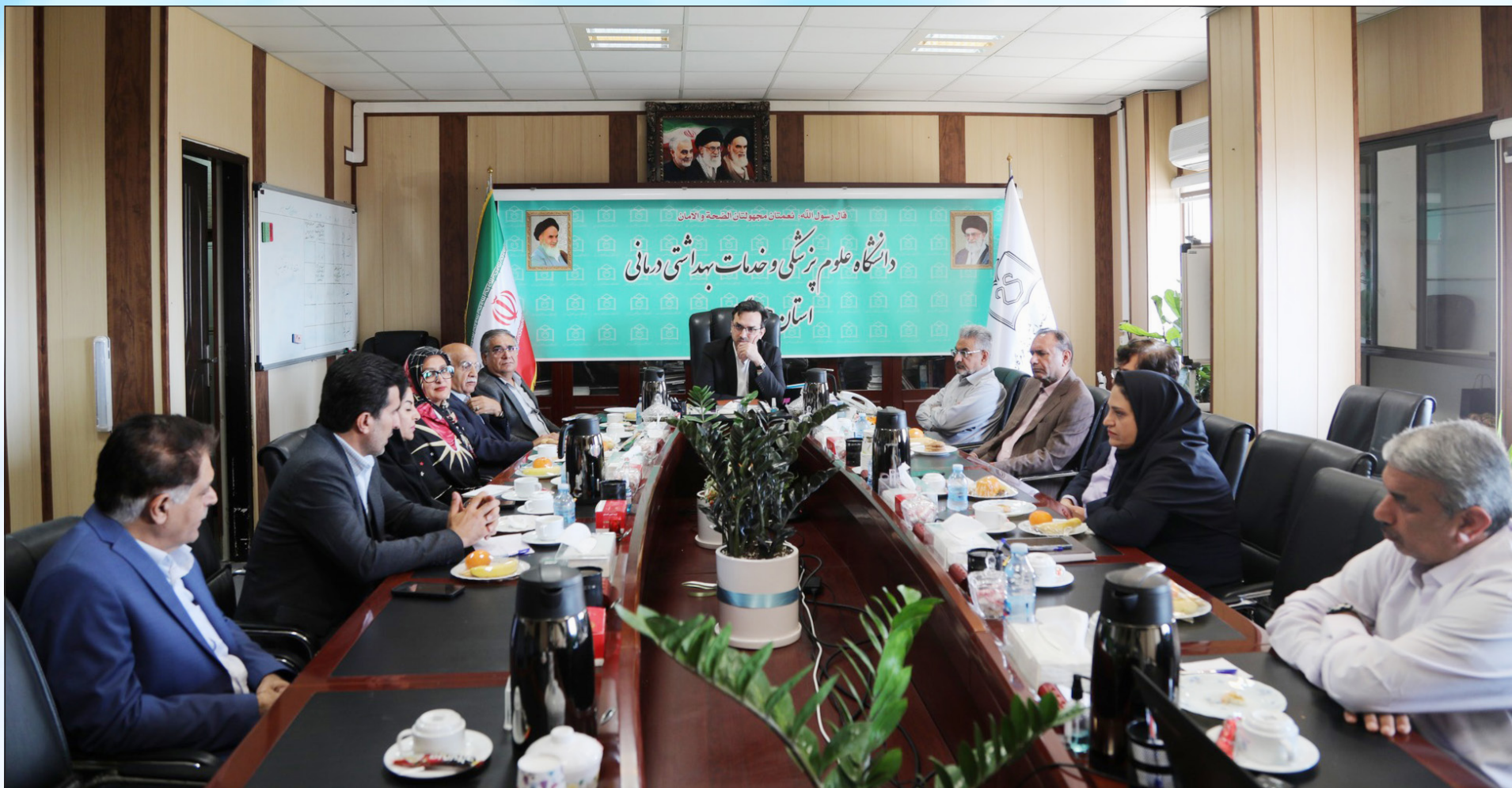
مهر تا مهر دستاورد دولت چهاردهم در حوزه بهداشت و درمان آستان همرگان